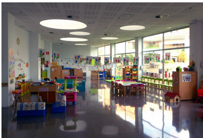
Així és l'espai familiar Creixença situat a la Biblioteca Municipal | Ajuntament de Rubí

Hi ha diverses accions: un espai terapèutic individual, experiències de grup i acompanyament a domicili